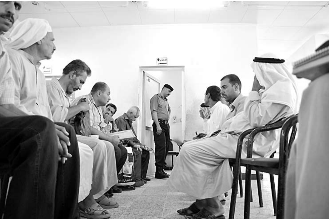
ژمارەيەك دانیشتووی عەرەب و كورد لە نووسینگەى كەركوكى جيبە جيكردنى مادەى 140

لەدوای رووخانى رژيمەوہ 10 ھەزار خيزانى عەرەب ھاتوونەتە كەركوك