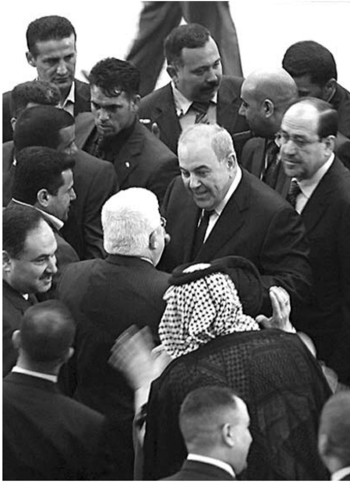
هه‌لمه‌ن پابان ره‌مى (هه‌ولتر (رووداو)

به نىوه زىاترى داواكارى‌ه‌كانى كورد رازىن