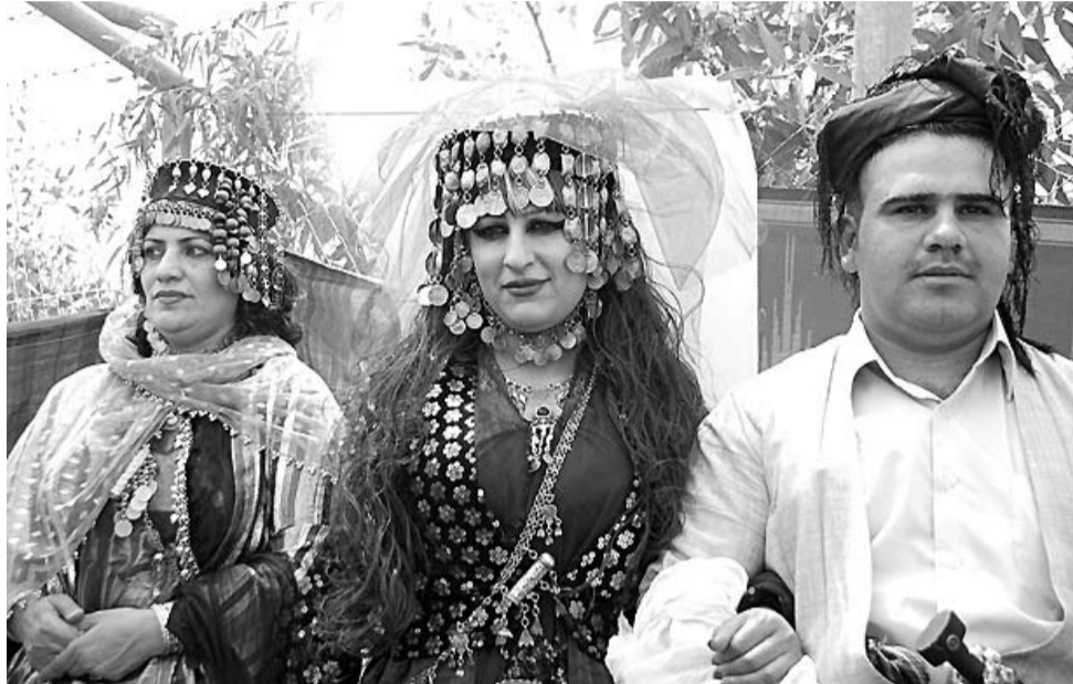
هه ورامیه کان ده لێن ئیتمه پێوه ی له وه نریتانه ناکه ین که ده بینه هۆی به رته سکرکردنه وه ی نازادیه کانی ژن

ژنیکی که رکوک ی به هۆی شوکردنی به پیاویکی هه ورامی، ئیستا که وتوته نیو هه ورامیه کان و له ناحیه ی بیاره له گه ل میرده که ی و کوره ته مه ن دوو سالییه که ی، ژیانیکی ساده به سه ر ده بات، ئه و ژنه زۆر دلخۆشه به وه ی نازادیه کی ته و او به دیده کات بو هاره گه زه کانی له هه ورامان. گوئی " نازادیه کی لیره هه به، له هیچ کوپیه کی کوردستاندا نییه."