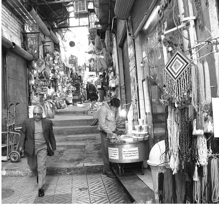
سزاکان كارگه ربیان به سه ر روژه لاتی كوردستانه وه هه ستیكراوه