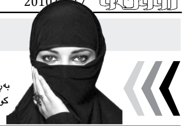
که رکوک (روودا)

رۆژی 2010/8/11 له یه کێک له شه قامه کانی گه په کی عرووبه، پۆلیسی عرووبه تهرمی شۆفیرێکی تاکسییان نۆزیه وه، که گرووبه چه کاره کان دواى کوشتنی فریوان دابوو. عقید شیزاد مارف به پێوه به ری پۆلیسی گه په کی عرووبه له که رکوک به (روودا) راگه یاند "تیرۆریستیکی خوشکه که ی خۆی نارووه ته لای ئه و شۆفیره و په لگه لم رابویره، دواتر له جینگه یه ک براکه ی کوشتوویه تی و ئۆتۆمبێله که ی فراندوو،" به لام دواتر هه به هۆی خوشکه که یه وه گیراوه " به هۆی ده ستگیرکردنی خوشکه که یه وه، توانیمان بکۆزه که له پێشانگه یه کی ئۆتۆمبێل ده ستگیر بکه ین، که سه رقالی فرۆشتنی ئۆتۆمبێله که بوو."